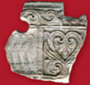
► Pila califal en mármol. Alcazaba de Almería, segunda mitad del siglo X.