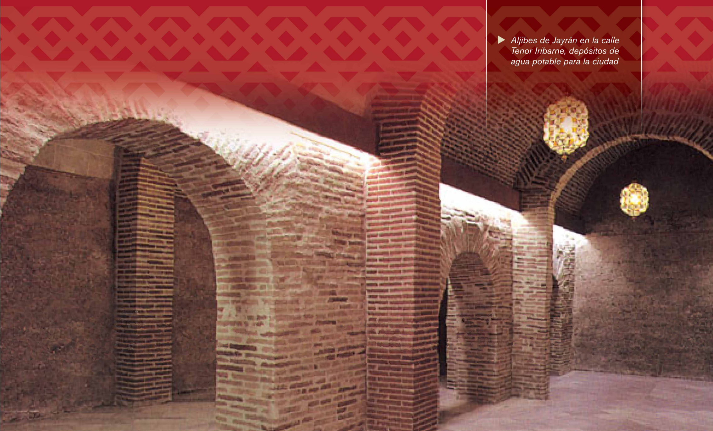
► Aljibes de Jayrán en la calle Tenor Iribarne, depósitos de agua potable para la ciudad