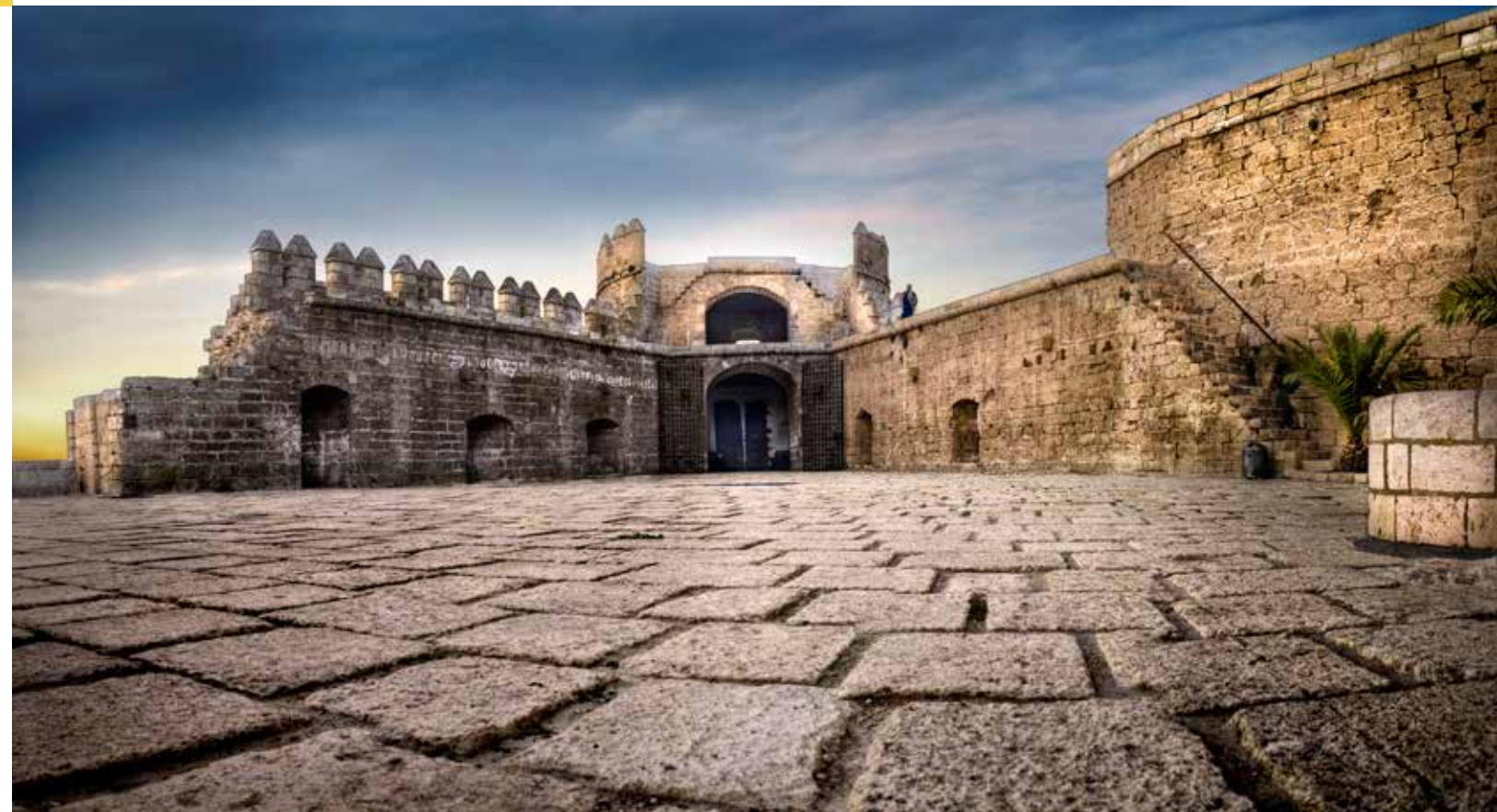
Patio de Armas del 3er recinto