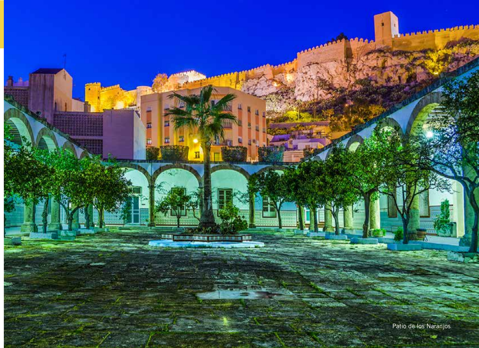
Patio de los Naranjos

Ciclo de conferencias: El Milenio del Reino de Almería: Cultura Y Civilización Andalusíes. Toponimia almeriense 19:00 h Lugar: Patio de los Naranjos