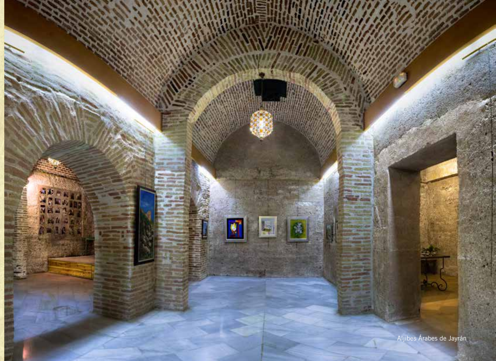
Aljibes Árabes de Jayrán

Jayrán Al-Amiri fue uno de sus muchos esclavos de raza eslava, que ganó su libertad al destacarse como oficial del ejército de Almanzor en la lucha contra los reinos cristianos. Almanzor fue derrotado en el 1002 en Calatañazor por un ejército cristiano. Con su muerte se iniciaría la decadencia del Califato de Córdoba que desencadenará en la creación de los Reinos Taifas, siendo Jayrán el primer rey de la Taifa de Almería desde 1014 a 1028.