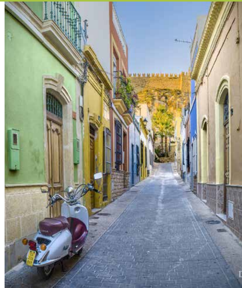
C/ Descanso. La Almedina

29 Rutas Guiadas Tesoros del Milenio “Baja Alpujarra. Berja-Dalías” Exposición “ Tesoros del Milenio” Salida desde Almería: 9:00 Biblioteca Villaespesa