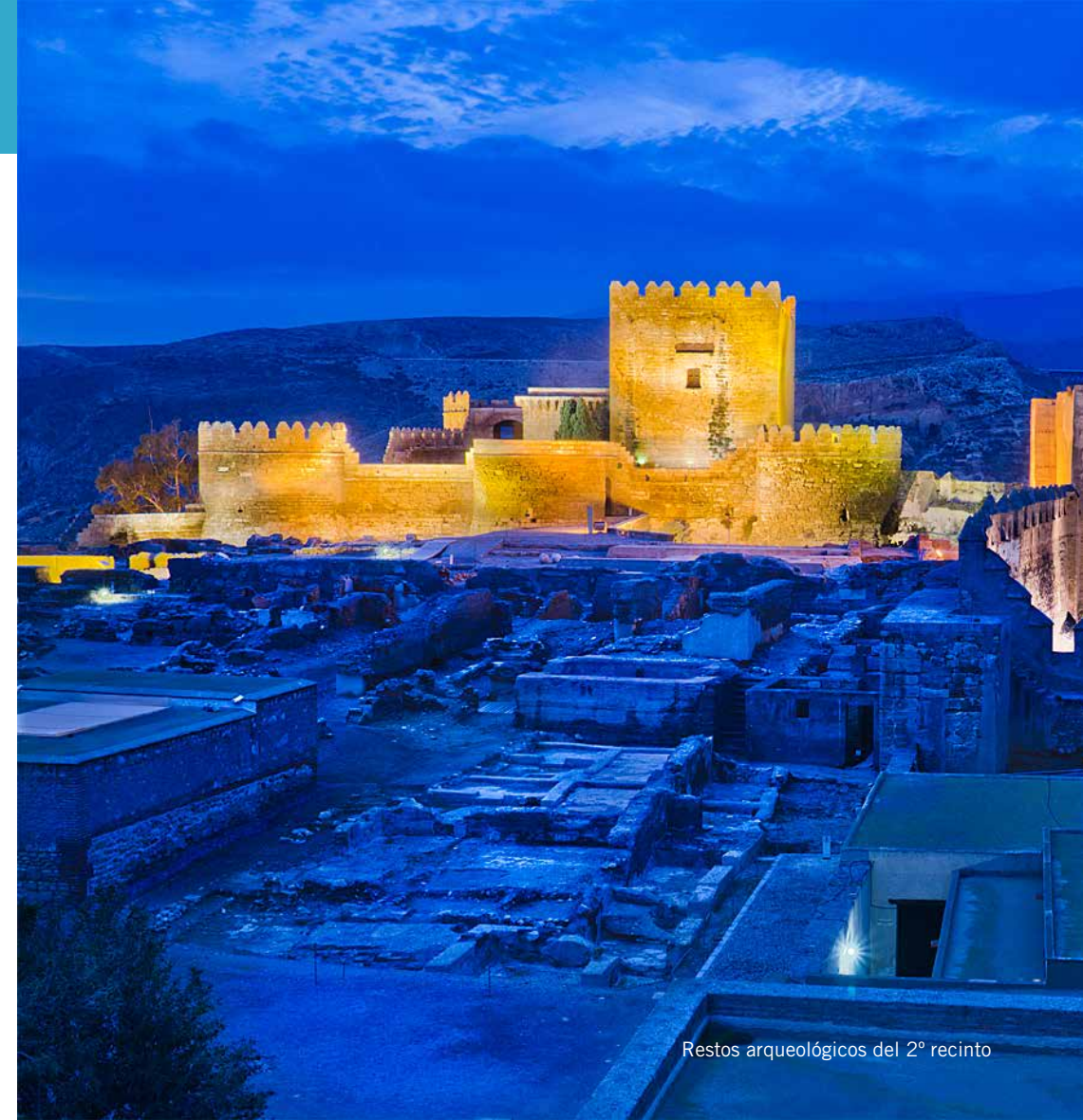
Restos arqueológicos del 2º recinto

Visitas Guiadas 10:00 Milenio de Almería. La Alcazaba Lugar: Plaza Vieja