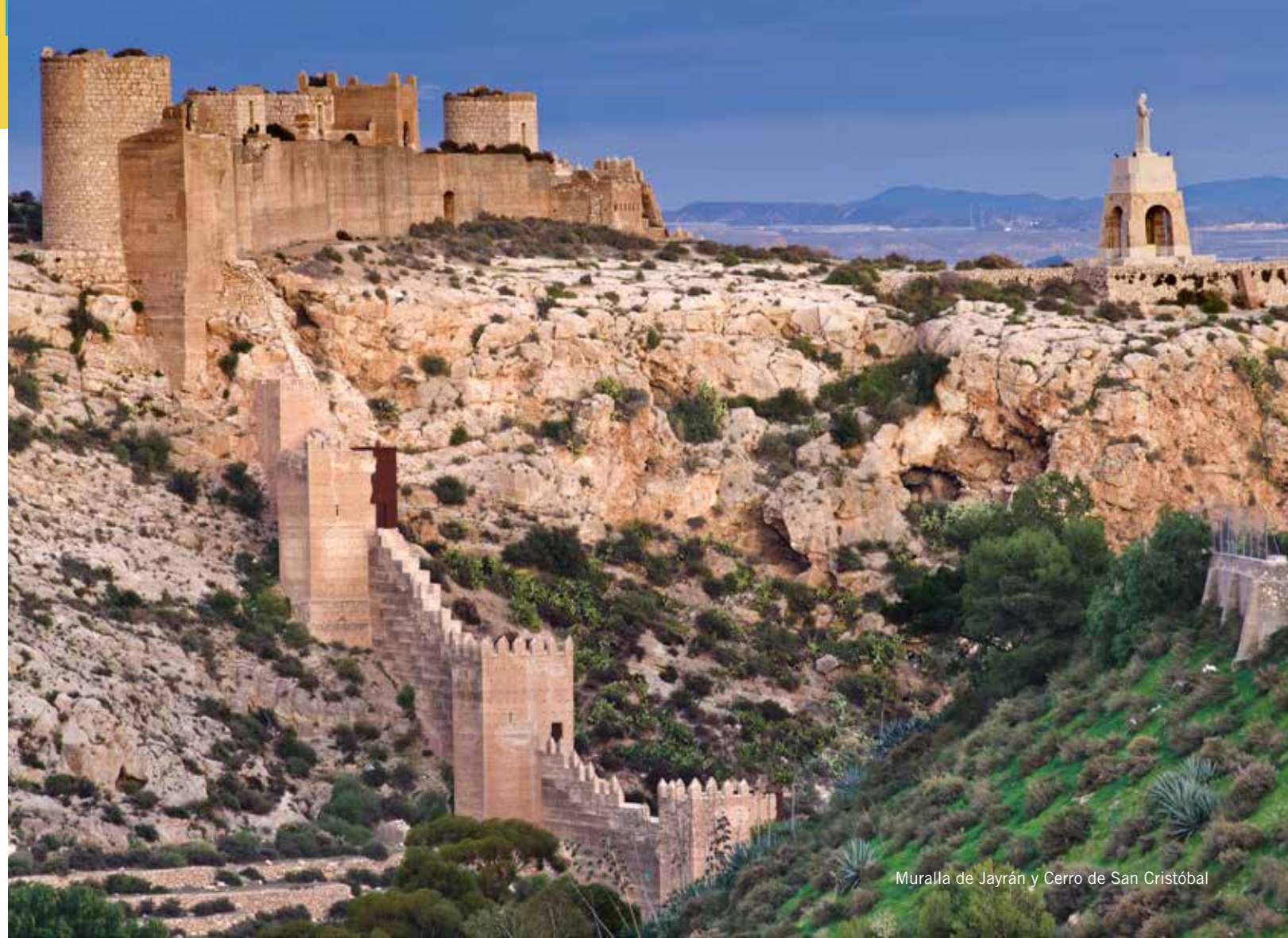
Muralla de Jayrán y Cerro de San Cristóbal