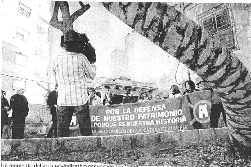
Un momento del acto reivindicativo convocado por 'Amigos de la Alcazaba'.