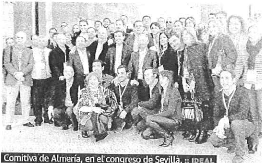
Comitiva de Almería, en el congreso de Sevilla.

El vendedor manifestaba ayer encontrarse «muy feliz» y emocionado por que este premio va a venir como anillo al dedo porque mucha gente está desesperada por coger algo».