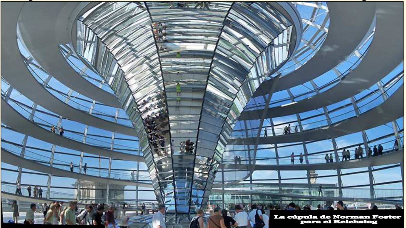
La cúpula de Norman Foster para el Reichstag

Viaje de verano de la AAAA, del 6 al 13 de julio